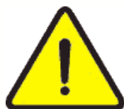
Riesgo en general inflamable